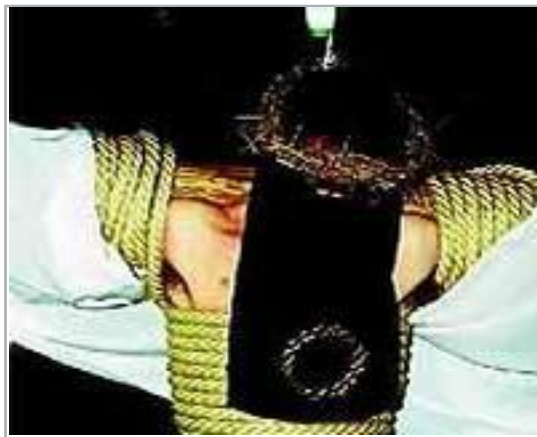
Empalao de la Hermandad de Penitentes de Veracruz

La particular fisonomía de muchas de las calles jerezanas, estrechas y recónditas, se presta a una vivencia profunda de este desfile desprovisto de cualquier ornamento para cobijar sencilla y calladamente la acción de la penitencia. Solo una imagen, la del Cristo de la Vera Cruz, de origen desconocido, interviene en este desfile penitencial y es llevada por hermanos penitentes vestidos con